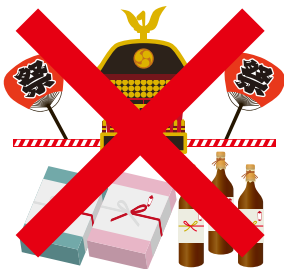
お祭りなどへの差し入れ