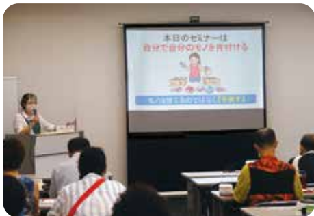
元気なうちに3Rでお片づけセミナー