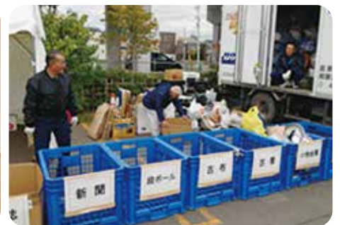
出前式資源回収実験