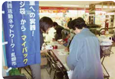
スーパー店頭でのレジ袋削減啓発