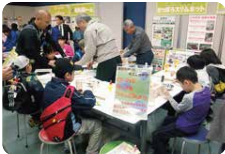
環境科学展での啓発活動