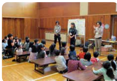
環境教育出張講座