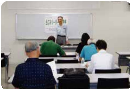
生ごみリーダー養成講座