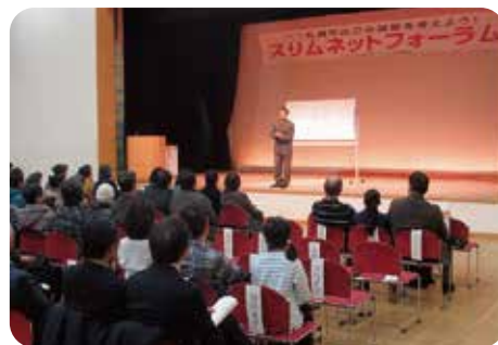
10周年記念フォーラム