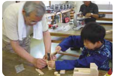
廃材を使った木工工作教室