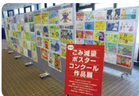
ごみ減量ポスターコンクール