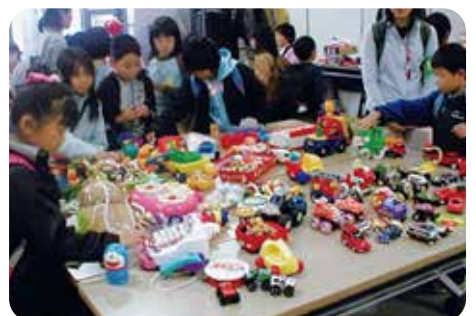
おもちゃばくりっこ