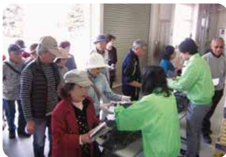
生ごみ堆肥の無料配布