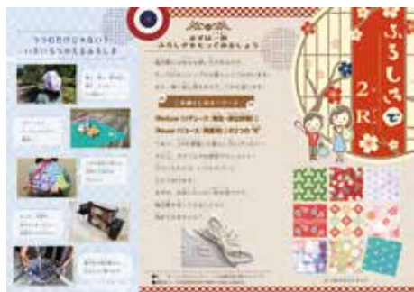
「ふるしぎで2R」リーフレット