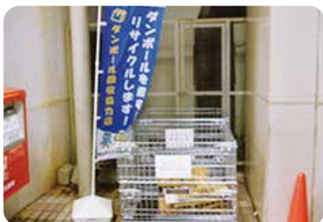
ダンボール拠点回収事業