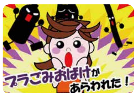
海洋プラスチックごみ問題啓発紙芝居