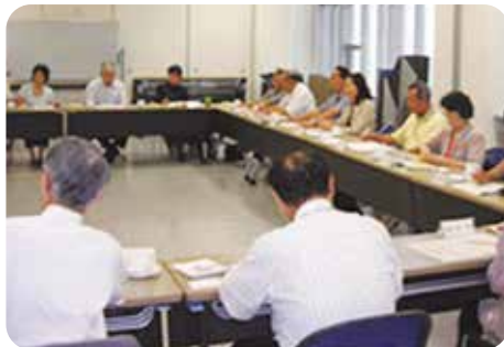
生ごみリーダー・生ごみ地域内循環活動団体交流会