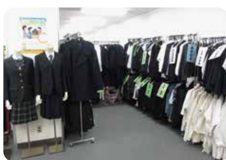
制服リユース実験事業