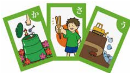
よくな〜るかるた -さっぽろ環境かるた-