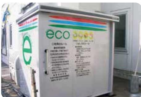
エコボックス設置助成事業