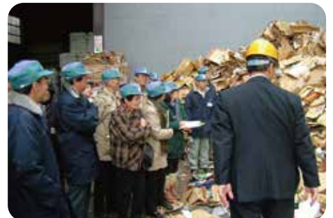
資源化施設等の視察会