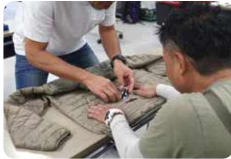
衣類のリペアイベント