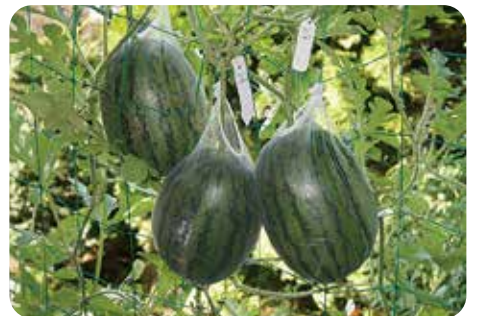
自家製堆肥でガーデニング!フォトコンテスト