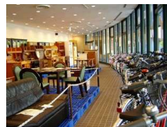
リサイクルプラザ(内観)

ごみの分別やごみ減量意識の啓発を図る各種教室・出前講座や施設見学会のほか、エコ相談コーナーでの相談対応や、常設の情報展示コーナーに加え、重要なテーマに係る特設展示を行うことなどにより、分別等に関する情報発信を実施。