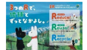
キャンペーン令和3年度ポスター