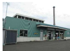
リユースプラザ(外観)

ごみ減量にかかる各種教室講座や市民団体との協働によるエコイベントのほか、併設する地区リサイクルセンターでの資源物の受け入れやごみ分別にかかる啓発などを実施。