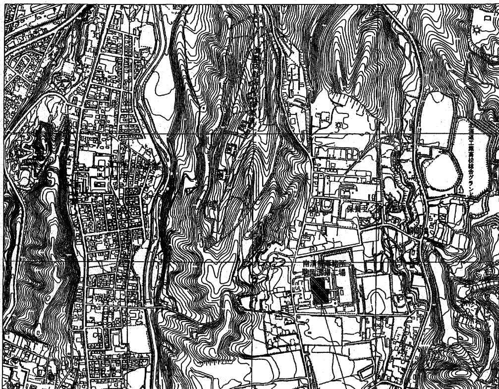
駒岡清掃工場 札幌市南区真駒内602番地