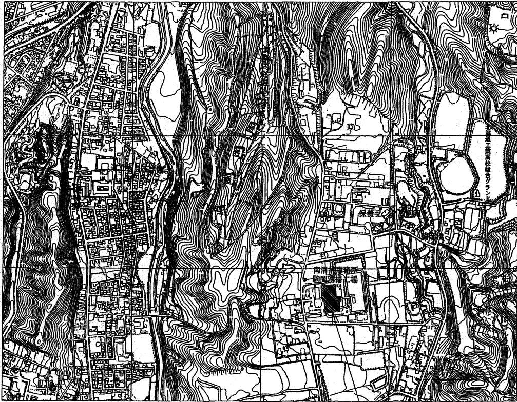
駒岡清掃工場 札幌市南区真駒内602番地