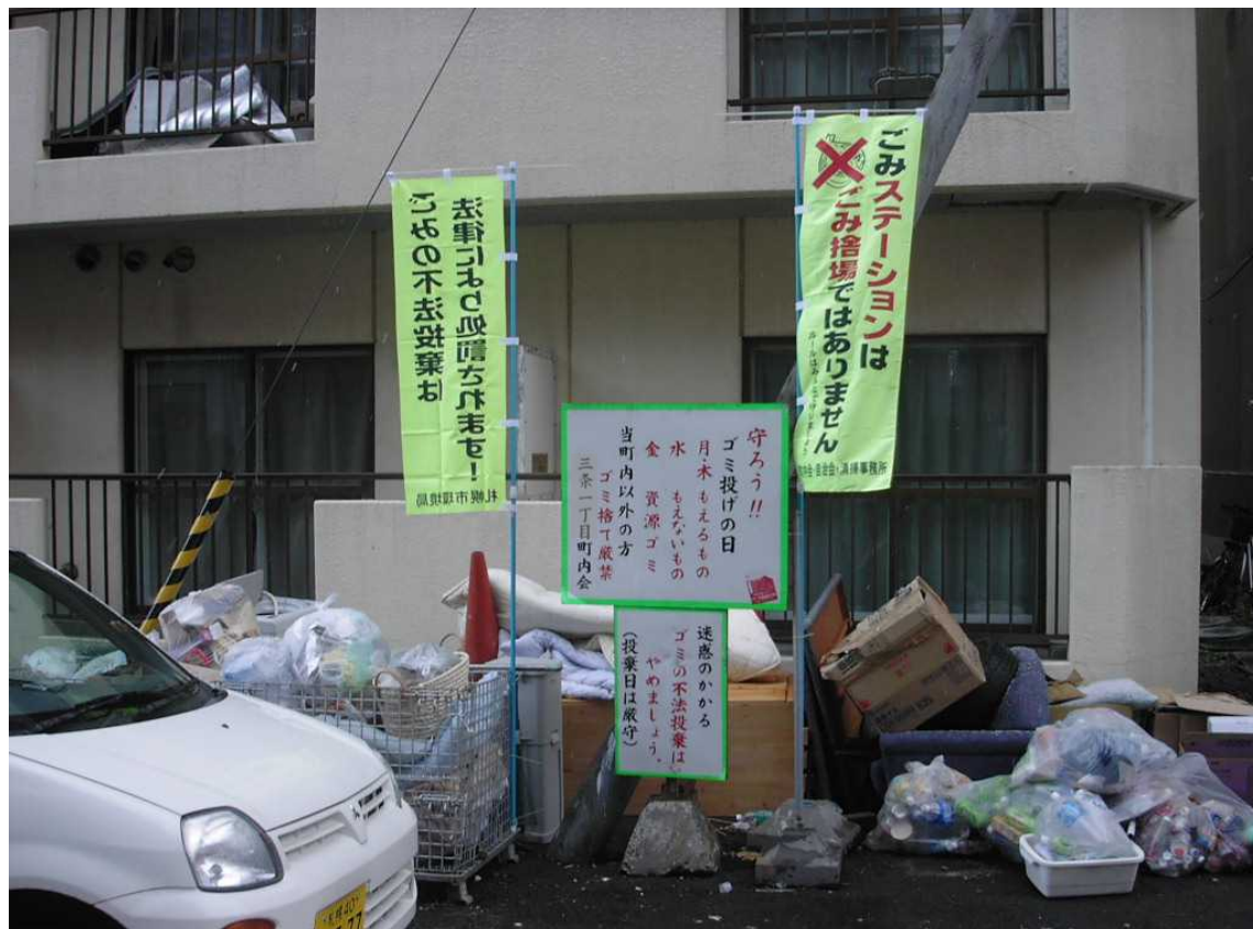
戸建住宅と共同住宅が共用しているごみステーションの様子