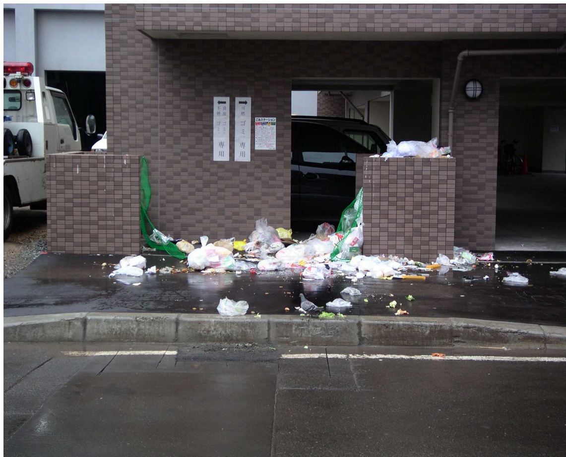
と同様（ごみステーションから溢れた生ごみが散乱している）