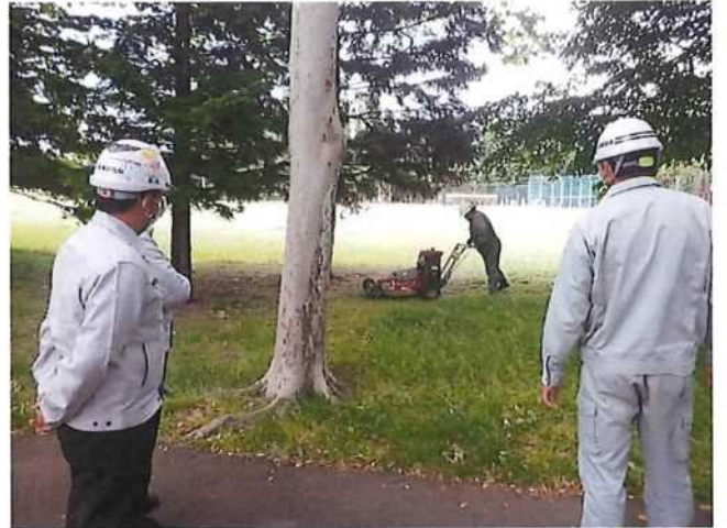
安全パトロール実施(施工状況確認)