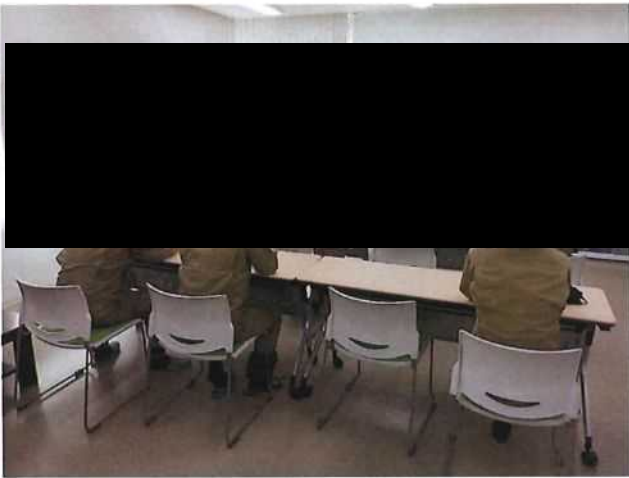
現場内教育(維持管理作業)