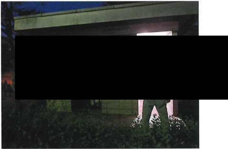
夜間パトロール実施