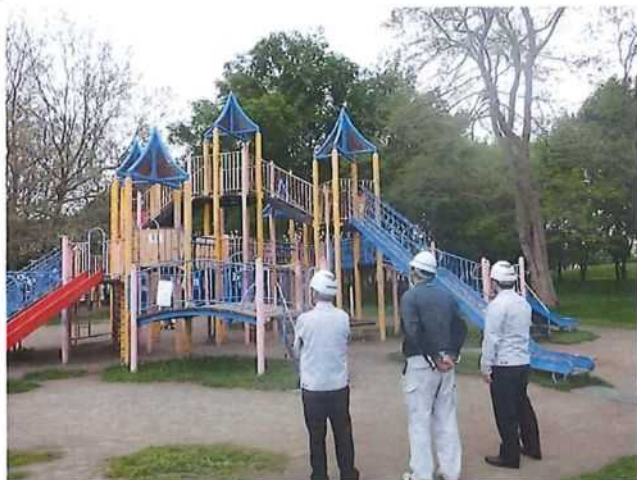
安全パトロール実施