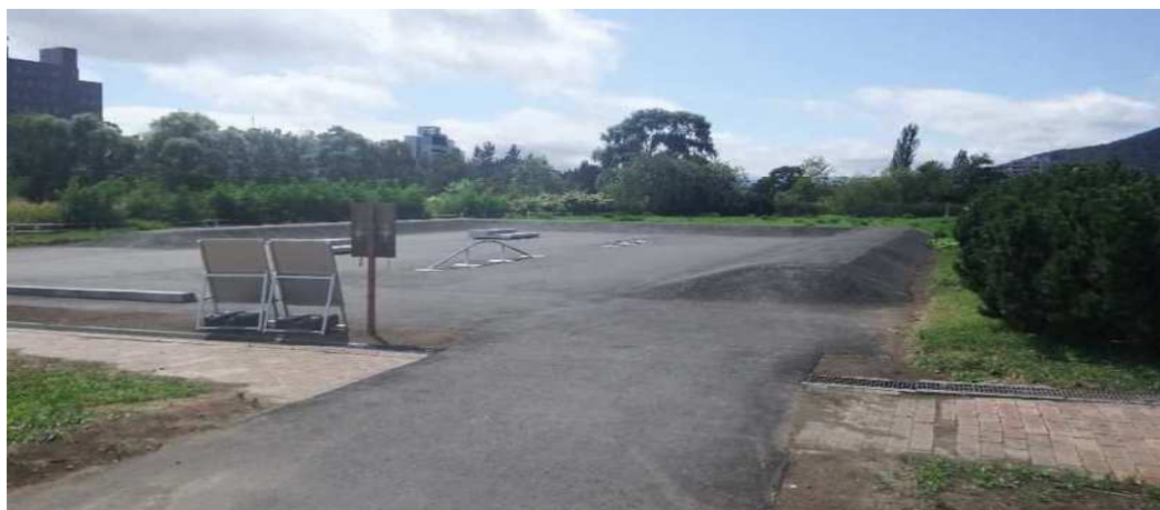
仮設スケボー エリア 現場写真