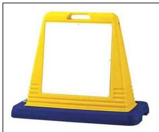
置き型看板 イメージ写真 (想定重量：10 kg程度)