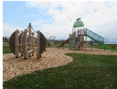
さっぽろさとらんど (アスレチック遊具)