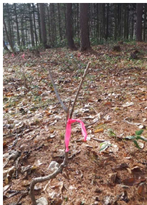
食害を受けた苗木