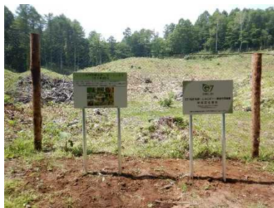
森林整備後に設置した案内看板 (白旗山都市環境林)