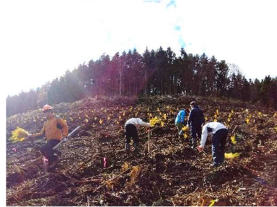
伐採跡地の植樹活動