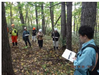
私有林の現地調査