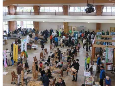
道民森づくりの集い 2023 (さとらんど)

②白旗山都市環境林等の自然歩道等において、散策の安全を図る案内看板の充実化を図るほか、自然歩道沿い等において森林整備が行われた箇所には 森林整備の目的を説明する看板等を整備し、自然歩道等の利用者に対し普及啓発を図ります。