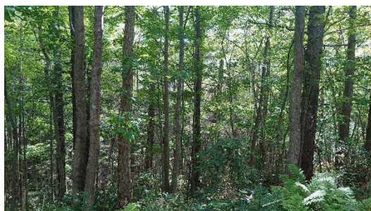
針広混交林化が進んだカラマツ林