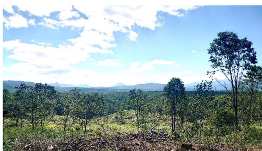
皆伐時に樹木を一定程度残す取組 (白旗山都市環境林)