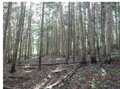
経営管理権集積計画を策定したアカエゾマツ林