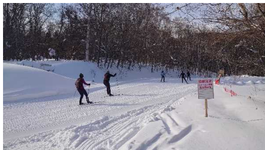
スキーコース (白旗山都市環境林)