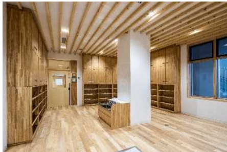
中央区保育・子育て支援センター (ちあふる・ちゅうおう)