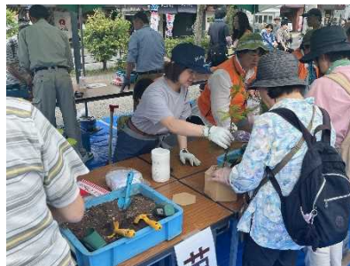
植樹用のカミネツコン制作 (水源の森づくり 2024)