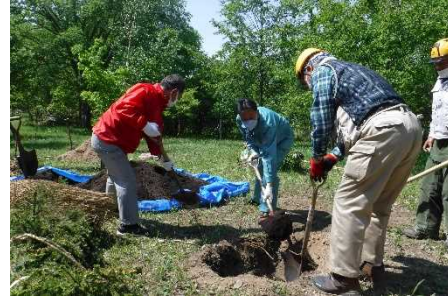
植樹活動(企業 CSR 活動)