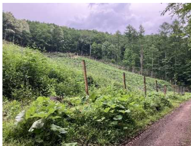
植栽地のエゾシカ侵入防止柵