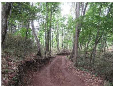
小規模の森林作業道(私有林内)