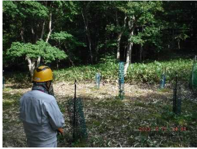
ボランティアによるシカ食害防止ネット設置