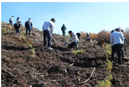
伐採跡地の植樹活動 (白旗山都市環境林)