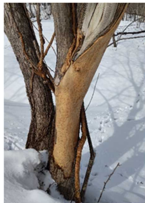
エゾシカによる樹皮剥ぎの跡