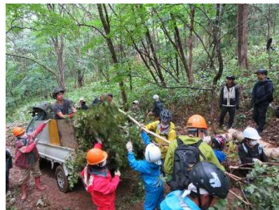
森づくりのイベント