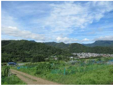
農地と森林が広がる里山の風景