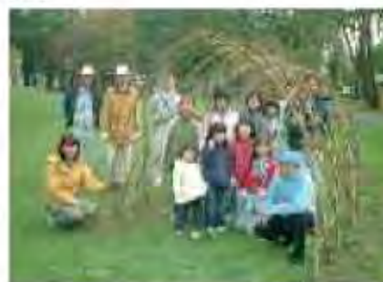
公園を使った市民活動[美香保公園]

○気軽に活用できる公園があるまちづくりのために、主要な公園のほか、地域の公園緑地においても市民のニーズを踏まえながら、市民や活動団体などとの連携による公園の活用を推進します。