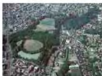
再整備を進めている月寒公園

○大規模公園（都市基幹公園など）については、環境保全、景観づくり、災害に強いまちづくり、市民のレクリエーション活動の促進など公園が持つ機能について、地域の充足度を踏まえ、たうえで、既存施設の統廃合も含め、施設の配置や機能のあり方を検討し整備を進めます。