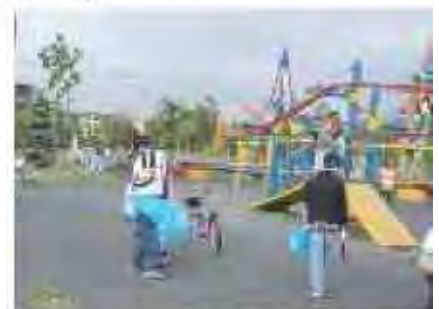
学校との連携による公園の清掃 [屯田公園]

○個人・団体などの多様な市民が公園の管理運営に参画することで、市民がみどりとふれあうことができる機会を増やすとともに、公園における市民活動を起点とした地域コミュニティの醸成につなげていきます。