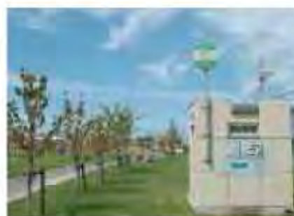
緊急貯水槽を設置した公園[曙西公園]

○災害時における公園緑地の重要性について、市民の理解を深めるとともに、公園緑地における防災機能のPRを進め、防災面でのみどりの効果についての市民理解を深めます。