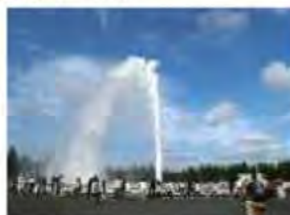
海の噴水[毛エレ公園]

○主要な公園において、市民ニーズを踏まえ、指定管理者や活動団体、企業との連携により公園の特徴を活かした魅力を一層高めることで、市民や観光客がこれまで以上に楽しむことができる魅力的な公園づくりを推進するとともに、より効果的なPRを進めます。