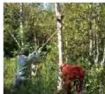
森林ボランティアによる活動

○公園ボランティアや森林ボランティア、さっぽろタウンガーデナー（緑の愛護員）といった方々の専門的な知識・技術を効果的に活かしていくために、それぞれの活動の機会を市民活動などと連携して設けます。