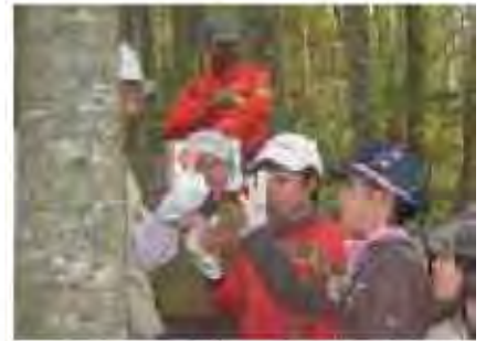
森を使った環境教育の展開

○教育機関や関係部局などと連携を図りながらガイドブック・環境副教材の作成や、活動の場や機会の提供など、市民や活動団体が行う環境教育活動への支援に取り組むことで、子どもたちなどへの継続的な環境教育を推進します。