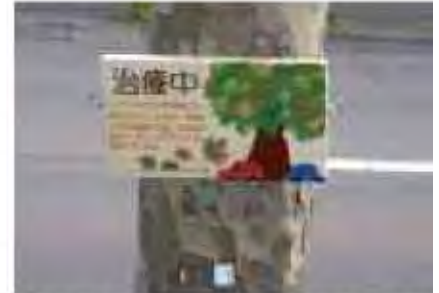
病気の樹木であることを知らせるサイン 【作製：札幌市立大】