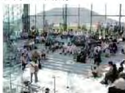
モエレファンクラブによる コンサートの開催[モエレ沼公園]

○より多くの市民がイベントに参加できる機会を増やすため、本市のみならず、市民、活動団体、企業によるイベントの開催や内容の充実に向けて、それぞれのイベントに合わせた場の提供や開催情報の市民PRなどの支援を進めます。