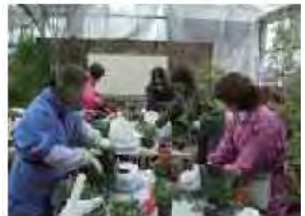
緑花園芸学校の講習会

○ボランティア活動に意欲的な市民に、花などのみどりの知識・技術の習得機会を提供するほか、活動団体のリーダーに対しては市民活動の企画・コーディネートなどにかかわるスキルを高める講習会を開催するなど、多様な担い手の育成を積極的に進めます。