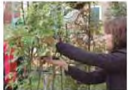
ガーデニングによる庭づくり

○地域の景観づくりにつなげるため、個人の住宅などにおける植樹やガーデニングに関するアドバイスなどの情報提供といったサポートなどを充実していくほか、コンテストの開催などによって、市民の機運を高めながら取組みを盛り上げていきます。