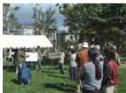
北大と協力した公園の利月調査

○札幌の気候風土や街並みに適したみどりの技術づくりを進めるため、学校・研究機関・行政機関などと協力・連携によりみどりに関する調査や技術開発を進めます。