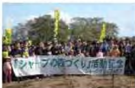
企業との連携による植樹 (山口緑地)

行政や活動団体が企画する植樹祭や、企業の森づくり活動などを通して、新たな森づくりが進められています。