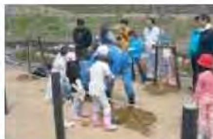
地域住民による公園への植樹 (五天山公園)