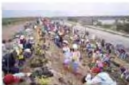
さっぽろふるさとの森づくり植樹祭 (山口緑地)