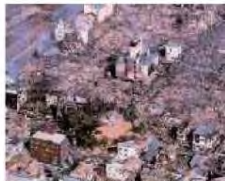
神戸市長田区大國公園

*公園や緑地をはじめとするオープンスペースは、災害時の避難場所、延焼防止帯として機能しています。これらを適切に配置・ネットワーク化することで、避難場所などとして重要な機能を果たし、街の安全性や市民の安心感を高めます。