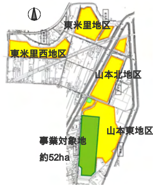
山本処理場全体区域図(全体面積約270ha)