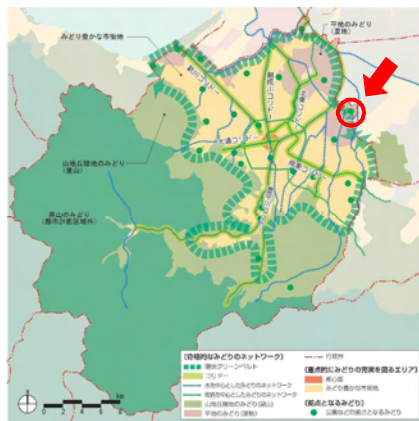
みどりの将来像図