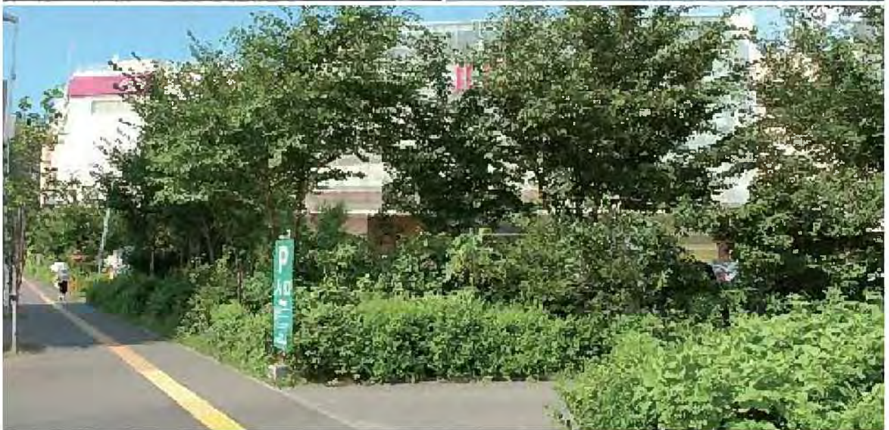
店舗やショッピングセンターの緑化