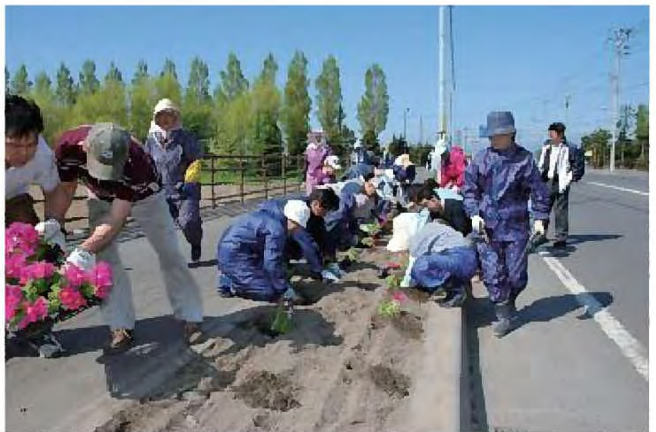
道路の柵花壇づくり[東区]

○花を活かしたみどりづくりをきっかけとした特徴ある地域づくり・まちづくりを目指して、さまざまな施策を活用しながら、家庭や地域・活動団体・学校・企業の活動と連携し、地域の歴史や文化と結びついた独自の景観づくり、さらには、地域コミュニティの醸成へもつながる取組みを推進します。