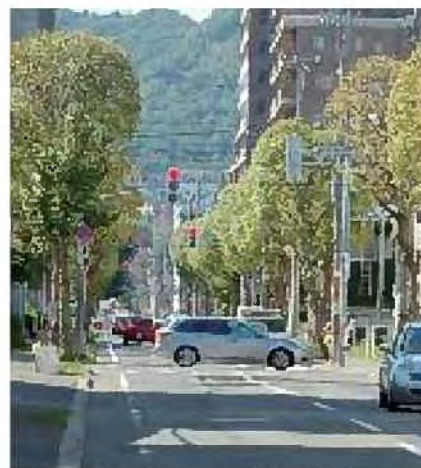
計画的な剪定による街路樹の質の向上 【北3条通】

○市民とともに街路樹を守り・育てるため、街路樹の効果や効用をPRしながら、街路樹に対する市民のより一層の理解を得ていくとともに、植栽環境に適した管理・育成・樹木の更新を行っていきます。