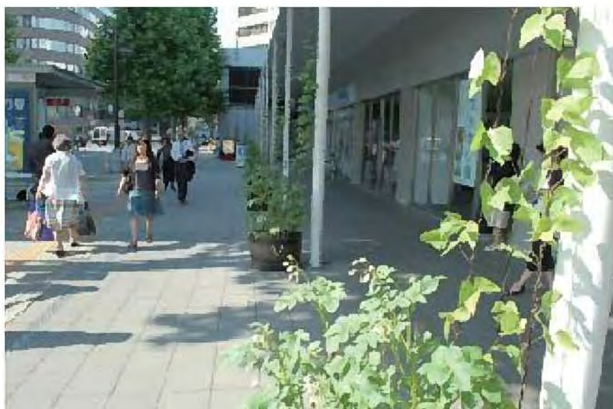
市民ホール前の緑化

○都心部における札幌らしい景観づくりの取組みとして、花やコニファーを用いたコンテナガーデンなどを活用した街並みづくりを、市民や企業との連携のもと進めます。