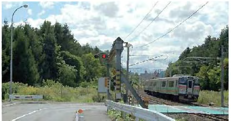
鉄道沿いの樹林地【厚別区】

○良好な景観維持に向けて、保存樹木制度や特別緑地保全地区の指定、地区計画などみどりの保全・創出にかかわる各種制度を、市民への普及啓発を図りながら積極的な運用を進め、地域に親しまれている樹林地などの保全や、身近なみどりづくりを総合的に推進します。