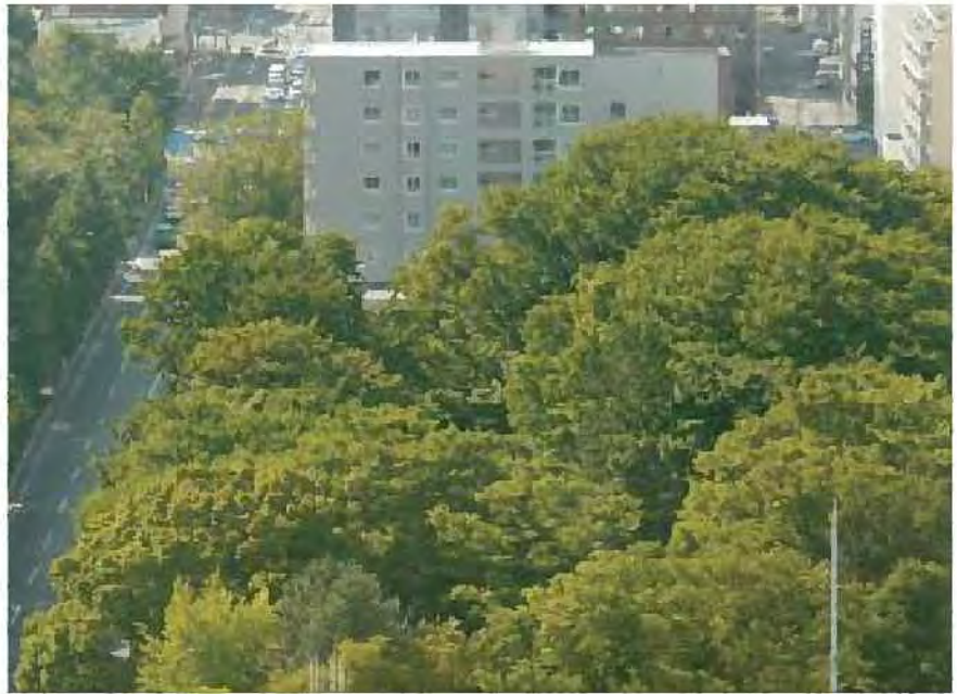
都心部の貴重なみどり

○都心部の象徴的な景観を創りだすとともに、札幌の歴史を物語る貴重な樹木などの保全を、公有地のみならず民有地においても進めます。また、景観や環境づくりのほか、人への安らぎや憩いを与えるなど、都市におけるみどりの機能の大切さを積極的にPRすることで、市民の理解と協力を得ながら、景観重要樹木や保存樹木の制度により保全に取り組めます。