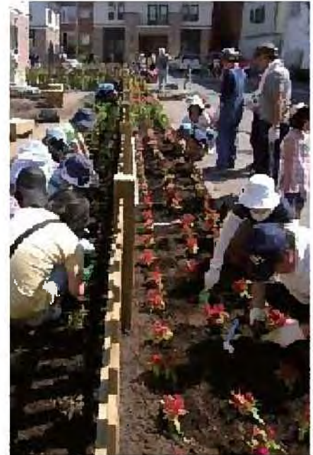
コミュニティガーデンづくり[東区]

○地域におけるみどりづくりに対する企業の参画を促すため、活動に対するインセンティブの創出やみどりづくりに関する情報提供を行うなど、CSR活動を支援するしくみづくりを進めます。