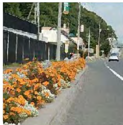
花による道路の修景【国道453号】

○北国らしい道路空間の創出を目指して、街路樹の保全と育成に加え、地域住民や企業との連携を通して植樹柵花壇やコミュニティガーデン、コンテナガーデンなど、さまざまな手法を用いた緑化のしくみづくりを進めることで、街並みと一体となった連続的な花を活かしたみどりの道路景観づくりを、まちづくり活動の一環として推進します。