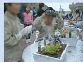
寄せ植え講習会の様子

企業の支援によるみどりづくりについて 企業の支援による寄せ植え講習会を開催しています。