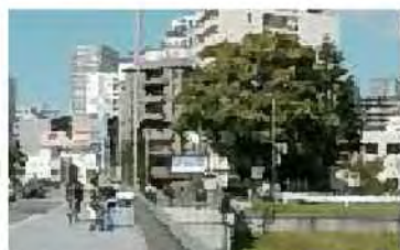
豊平橋の橋台広場第一