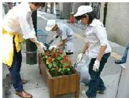
大通地区の商店街

●プランター植栽の例 小学校と商店街、行政の協働により、プランターの植栽が行われています。