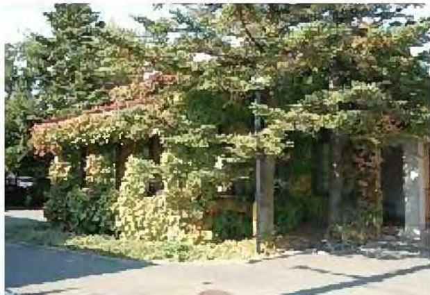
店舗の壁面緑化[南区]