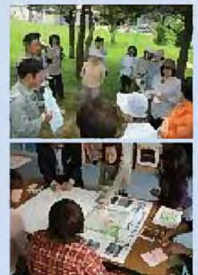
市民参加による 公園整備の検討

この事業は、地域住民の要望を広く取り入れた住民参加型が特徴で、地域に密着した、住民に親しまれる公園づくりを目指しています。