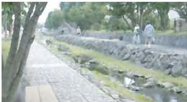
散策路の整備[安春川]

散策路の整備や、公園との一体的な整備により、河川を活かしたうるおいある都市環境づくりを進めています。