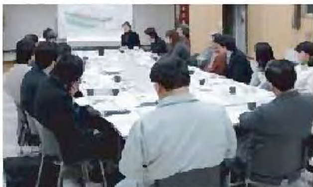
整備計画、維持指針の検討