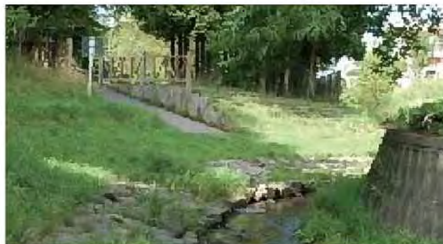
隣接公園との一体的整備[吉田川]