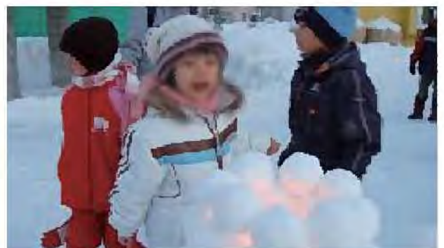
冬の遊び[白石東公園]