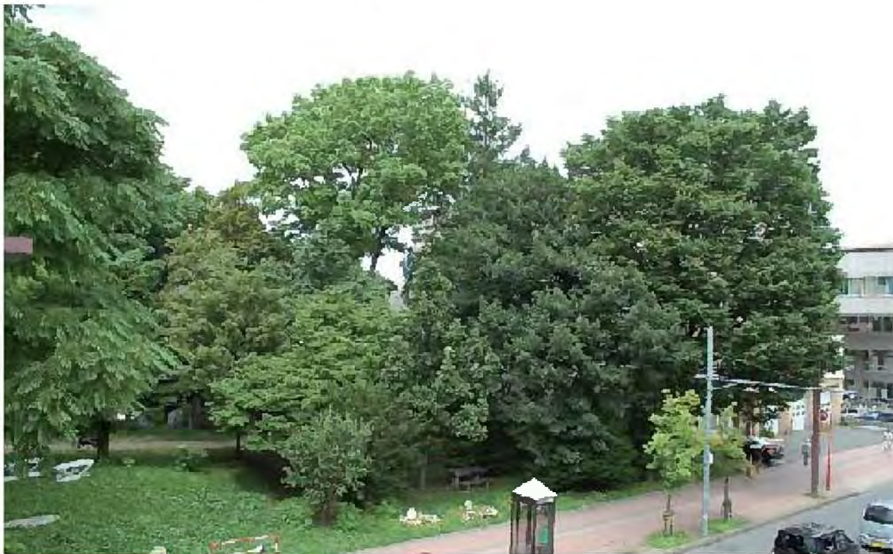
開拓期に植えられた樹木を保全[西区役所]