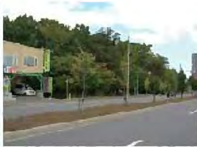
発寒特別緑地保全地区