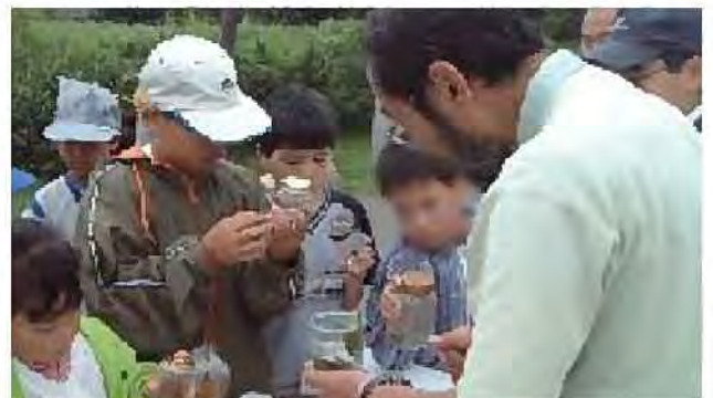
昆虫観察教室[前田森林公園]