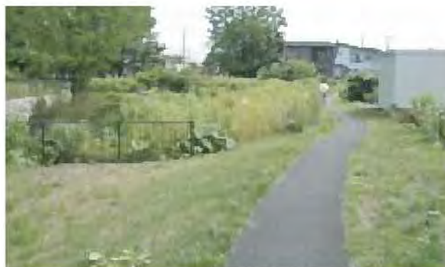
維持指針により保全された草地