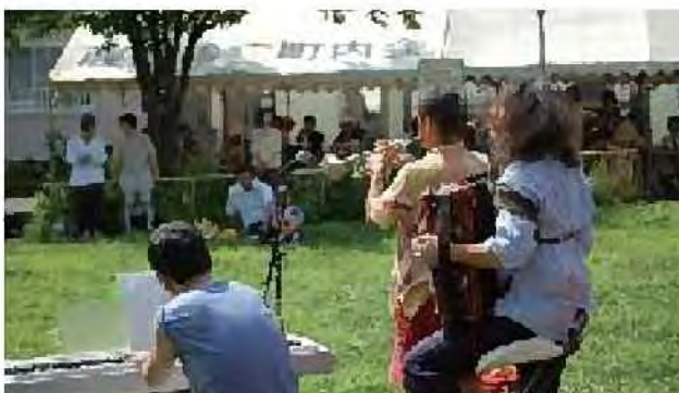
地域イベント[藤野むくどり公園]