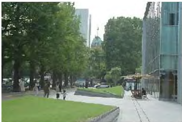
通りに面したオープンスペース[中央区]

通りに面した民有地のオープンスペースや敷地内の緑化を図り、民有地のみどりづくりが進められています。