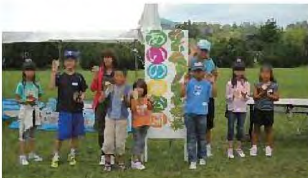
自然教育学級[あいの里公園]