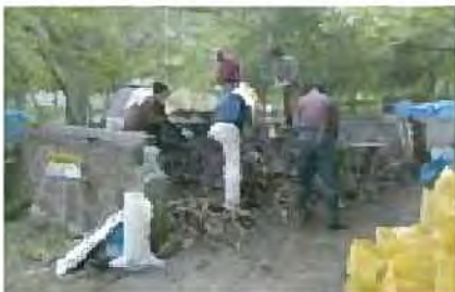
エドウィンダン記念公園