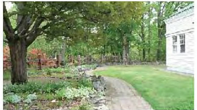
エドウィン・ダン記念公園