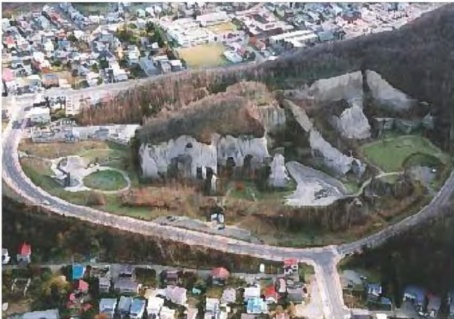
石切り場を活用した公園[石山緑地]