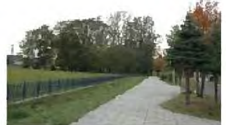
住宅地開発の際に保全された樹林 [清田区]