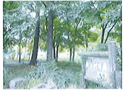
< 大学村の森 >