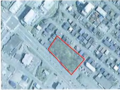
< 発寒特別緑地保全地区 >