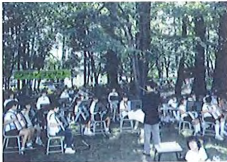
< ポプラ通コンサート >

地域に親しまれている貴重なみどりを活用し、近隣の小学校がコンサートを開くなどして活用しています。