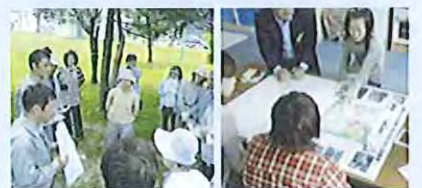
市民参加による公園整備検討の様子

この事業は、地域住民の要望を広く取り入れた住民参加型が特徴で、地域に密着した、住民に親しまれる公園づくりを目指しています。