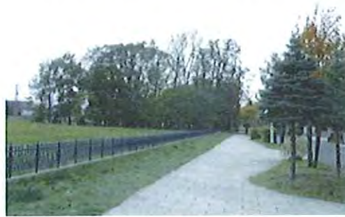
< 住宅地開発の際に保全された樹林(清田区平岡) >