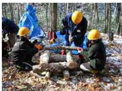
<間伐材を活用したきのごづくり>