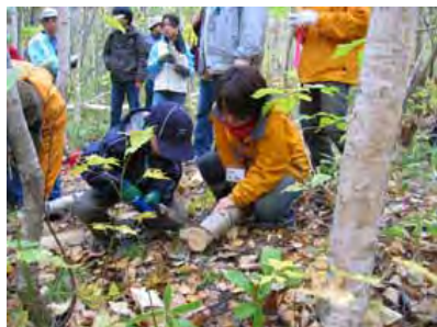
<間伐体験（旭山記念公園）>