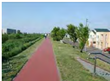
築堤を活用した緑化例 < 中の川 (桜づつみ事業) >