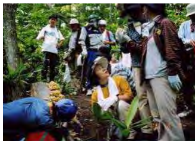
<きのご観察会（藻岩山）>