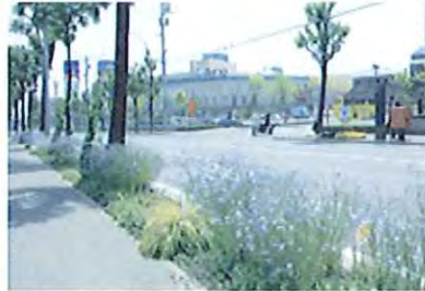
フラワーロードづくり