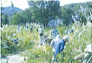
スズランの保全活動