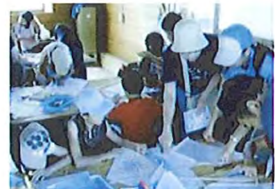
公園内の交流拠点での活動