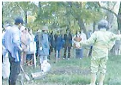
さっぽろ緑花園芸学校の 人材育成講習会