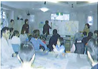
公園を整備するための 市民ワークショップ