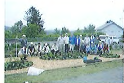
コミュニティガーデンづくり