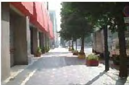
南1条道のグリーンオンパレード