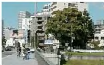
豊平橋の橋台広場第一