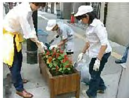
大通地区の商店街