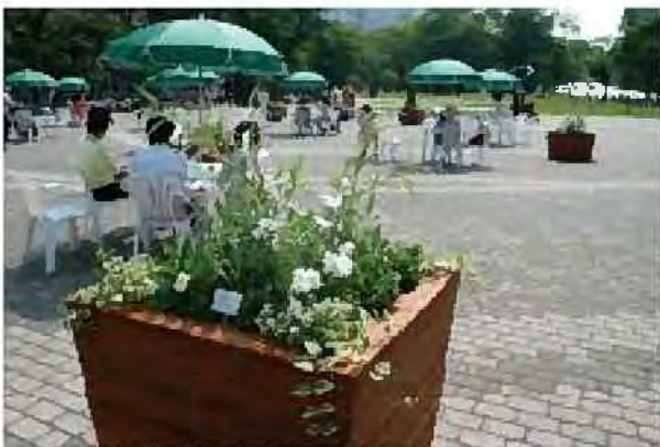
大通公園のコンテナガーデン

市民、行政との協働によるコンテナガーデンの設置により、彩りある都市景観がつくられています。