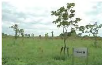
茨戸川緑地の企業による植樹