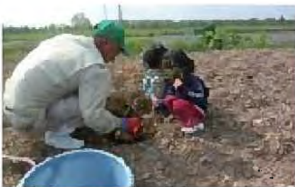
茨戸川緑地でのメモリアル植樹