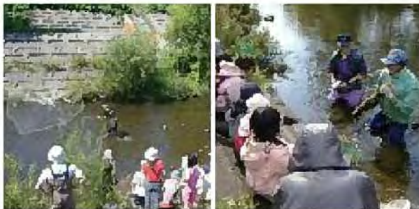
河川での環境教育[琴似発寒川]