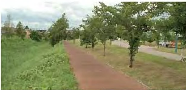
拓北いきいき公園