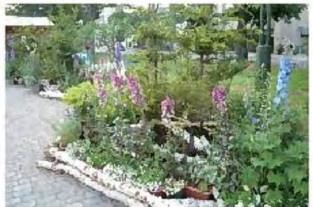
大通公園の花フェスタ