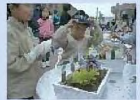
寄せ植え講習会の様子