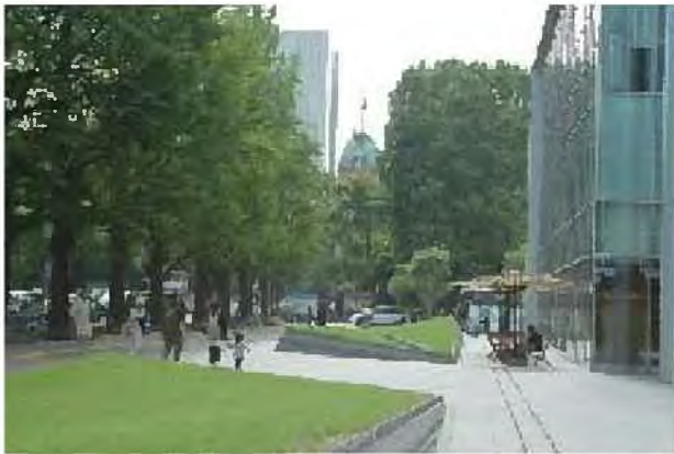
通りに面したオープンスペース[中央区]

通りに面した民有地のオープンスペースや敷地内の緑化を図り、民有地のみどりづくりが進められています。