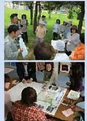
市民参加による 公園整備の検討

この事業は、地域住民の要望を広く取り入れた住民参加型が特徴で、地域に密着した、住民に親しまれる公園づくりを目指しています。