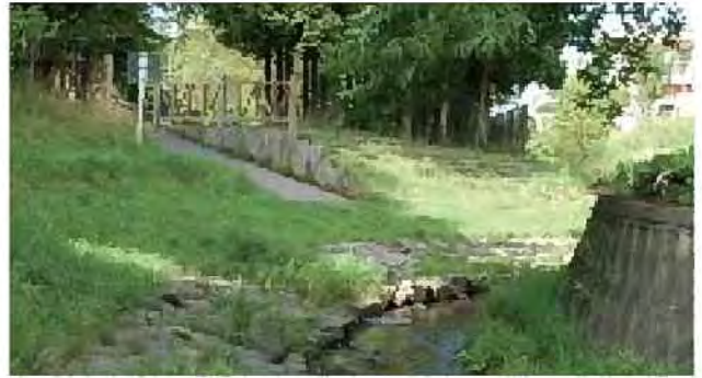
隣接公園との一体的整備[吉田川]