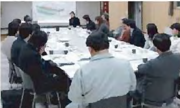
整備計画、維持指針の検討