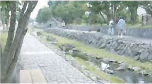
散策路の整備[安春川]

散策路の整備や、公園との一体的な整備により、河川を活かしたうるおいある都市環境づくりを進めています。