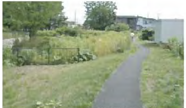
維持指針により保全された草地