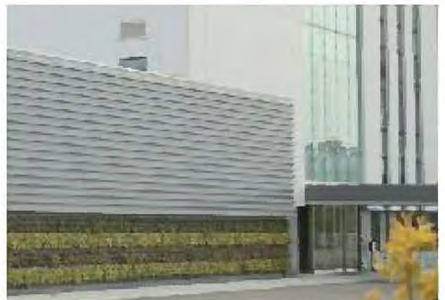
民間業務施設の壁面緑化[手稲区]