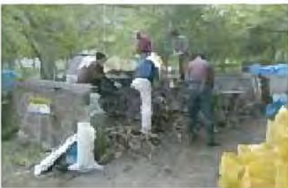
エドウィンダン記念公園