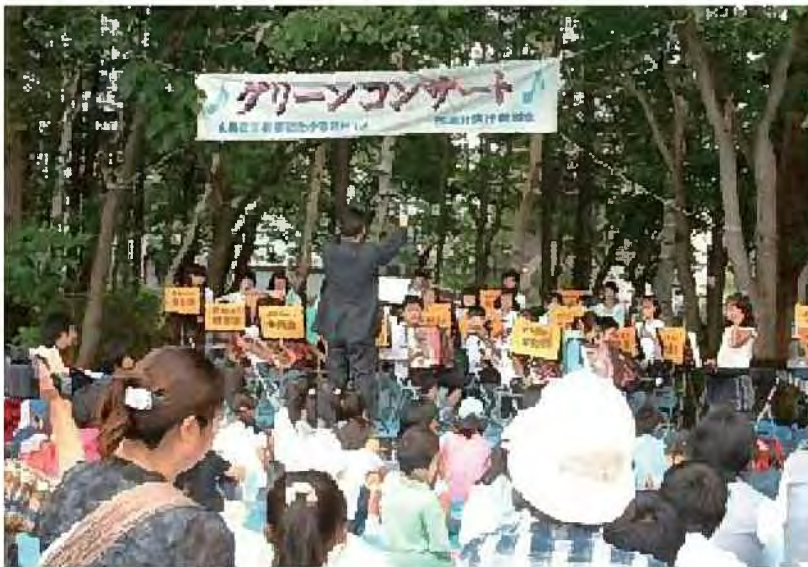
ポプラ通のコンサート [北区]

地域に親しまれている貴重なみどりを活用し、近隣の小学校がコンサートを開くなどして活用しています。