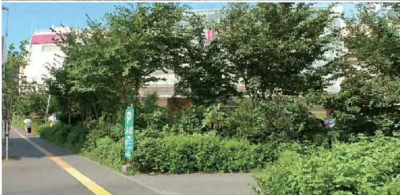
店舗やショッピングセンターの緑化