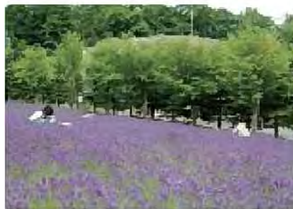
ラベンダー畑[東海大学]

大学や地域住民が協力して庭やオープンスペースにラベンダーを植え、ラベンダー発祥の地であることを活かした地域づくりを行っています。