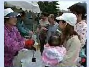
記念樹プレゼント