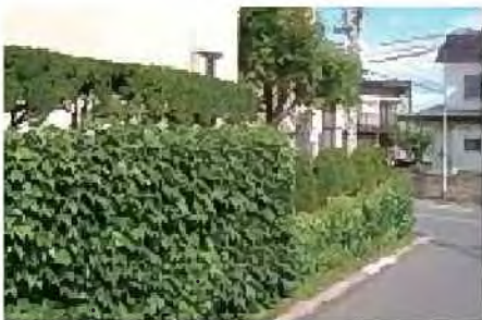
ツタ苗による緑化