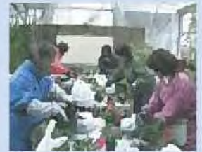
園芸講師育成技術講習会