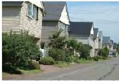
庭木を活かした住宅地