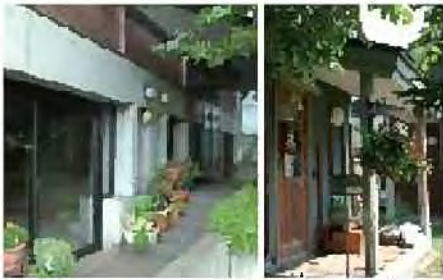
玄関先の花づくり

フラワーポットなどを用いた玄関先での身近なみどりづくりがまちにうるおいを与えています。