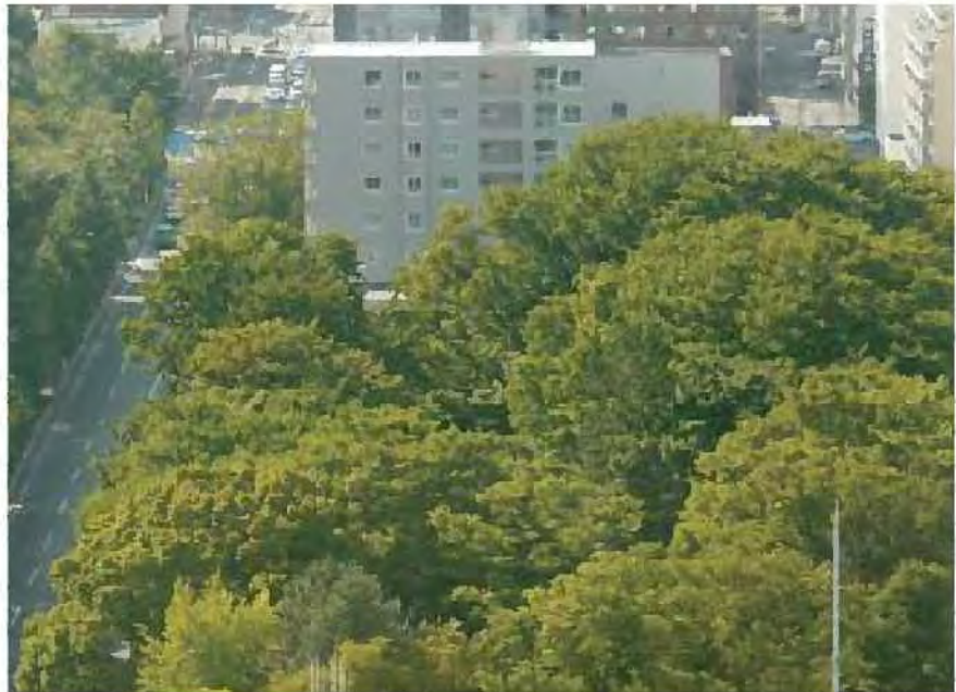
都心部の貴重なみどり

○都心部の象徴的な景観を創りだすとともに、札幌の歴史を物語る貴重な樹木などの保全を、公有地のみならず民有地においても進めます。また、景観や環境づくりのほか、人への安らぎや憩いを与えるなど、都市におけるみどりの機能の大切さを積極的にPRすることで、市民の理解と協力を得ながら、景観重要樹木や保存樹木の制度により保全に取り組めます。