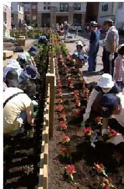
コミュニティガーデンづくり[東区]

○地域におけるみどりづくりに対する企業の参画を促すため、活動に対するインセンティブの創出やみどりづくりに関する情報提供を行うなど、CSR活動を支援するしくみづくりを進めます。