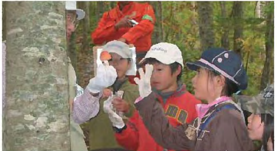
森を使った環境教育の展開

○教育機関や関係部局などと連携を図りながらガイドブック・環境副教材の作成や、活動の場や機会の提供など、市民や活動団体が行う環境教育活動への支援に取り組むことで、子どもたちなどへの継続的な環境教育を推進します。