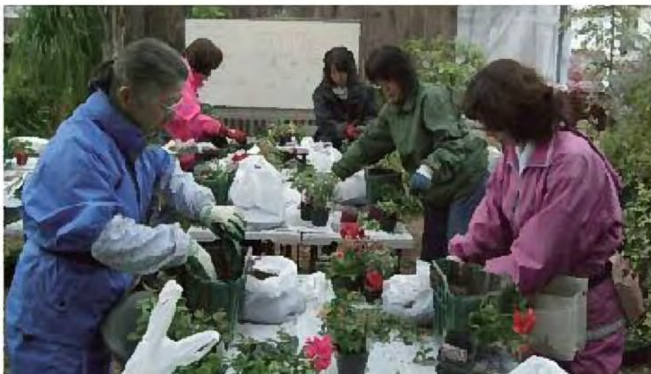
緑花園芸学校の講習会

○ボランティア活動に意欲的な市民に、花などのみどりの知識・技術の習得機会を提供するほか、活動団体のリーダーに対しては市民活動の企画・コーディネートなどにかかわるスキルを高める講習会を開催するなど、多様な担い手の育成を積極的に進めます。