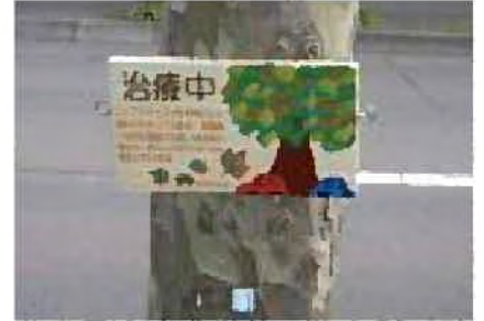
病気の樹木であることを知らせるサイン [作製：札幌市立大]

○行政や市民、活動団体、学校、企業などの情報をより効果的に提供するため、みどりに関する行政情報をホームページや、さまざまな情報媒体を活用し、魅力的でわかりやすい情報として広く発信します。