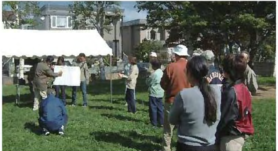
北海道大学と協力した公園の利用調査

○札幌の気候風土や街並みに適したみどりの技術づくりを進めるため、学校・研究機関・行政機関などと協力・連携によりみどりに関する調査や技術開発を進めます。