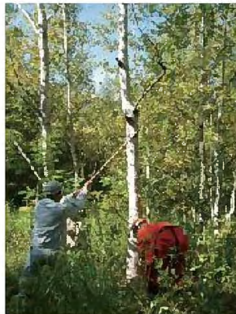
森林ボランティアによる活動