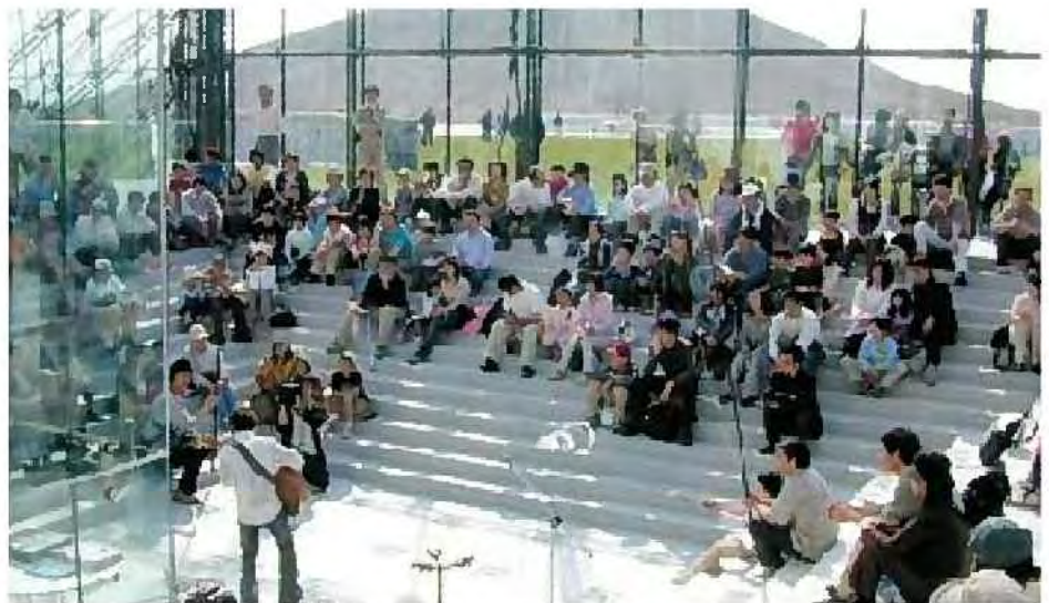
モエレファンクラブによるコンサートの開催[モエレ沼公園]

○より多くの市民がイベントに参加できる機会を増やすため、本市のみならず、市民、活動団体、企業によるイベントの開催や内容の充実に向けて、それぞれのイベントに合わせた場の提供や開催情報の市民PRなどの支援を進めます。