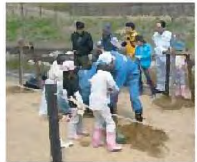
地域住民による五天山公園への植樹