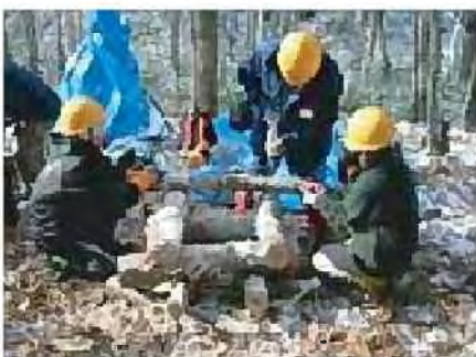
間伐材を活用したきのこづくり[清田区]