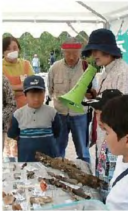
きのこ観察会[中央区]