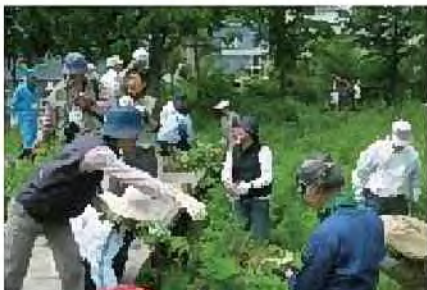
富丘西公園の草刈り