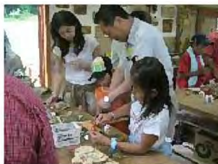
ふれあいの森での木工クラフト体験