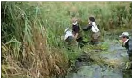
あいの里公園の沼清掃

公園、緑地内の草地や水辺を活用した、ふれあいの場づくりが活動団体によって進められています。