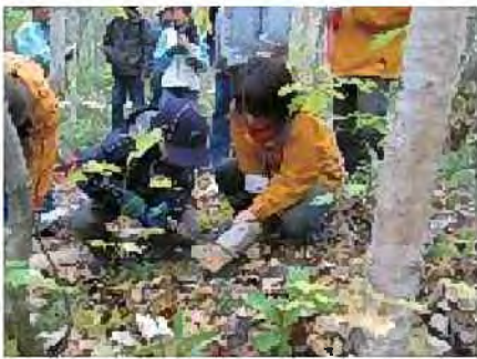
旭山都市環境林での間伐体験