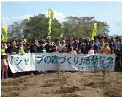
企業との連携による山口緑地での植樹

行政や活動団体が企画する植樹祭や、企業の森づくり活動などを通して、新たな森づくりが進められています。