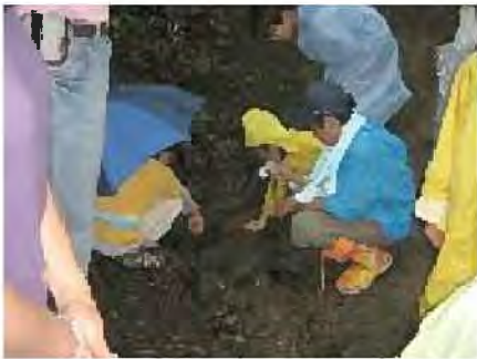
ふれあいの森の観察会