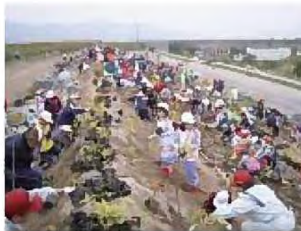
山口緑地で行われている さっぽろふるさとの森づくり植樹祭