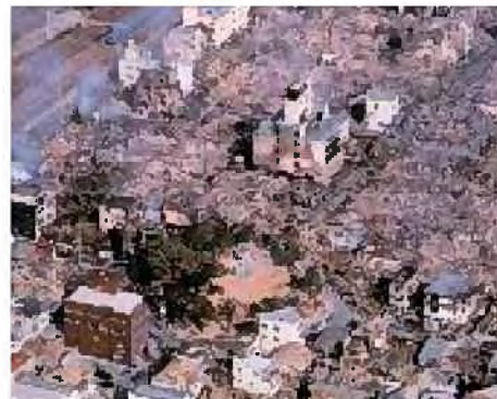
焼け止りになった公園

*公園や緑地をはじめとするオープンスペースは、災害時の避難場所、延焼防止帯として機能しています。これらを適切に配置・ネットワーク化することで、避難場所などとして重要な機能を果たし、街の安全性や市民の安心感を高めます。