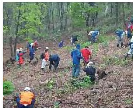
森林保全活動の様子

*公園や緑地などは、市民の健康増進につながるスポーツ、レクリエーション、休養、散策などの余暇活動の場となります。