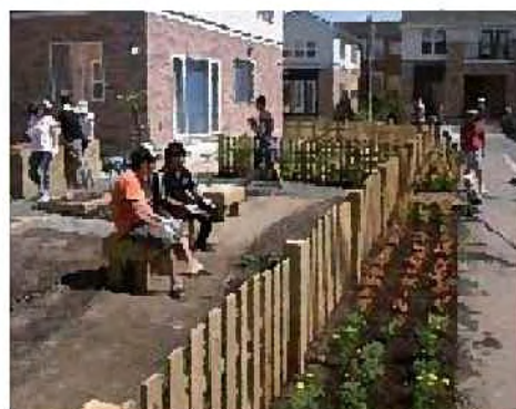
コミュニティガーデンでの語り