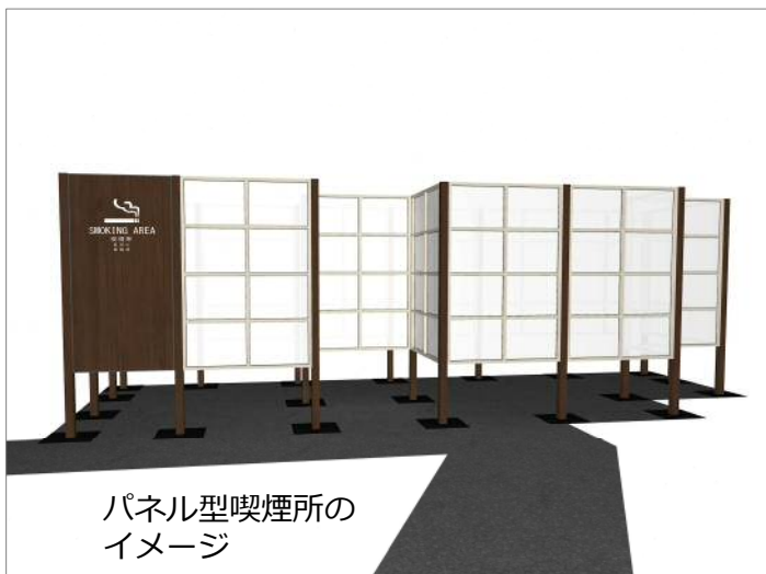
パネル型喫煙所のイメージ

このたび、大通公園西5丁目に試行的に喫煙所を設置することで、望まない受動喫煙対策への取組推進や、たばこを吸う方と吸わない方の双方にとって公園の利用環境が向上するか検証を行います。