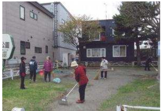
町内会による街区公園の清掃活動の様子

市民や活動団体は、家庭での庭づくりをはじめ、公園や道路の花壇づくりや清掃など、公共空間の緑化活動に参加することや、その活動の運営など団体として組織的に協力することが期待されます。また、一人ひとりがみどりの価値や機能について理解し、主体的に取り組むことで、みどりに対する意識を高めていくことが重要です。