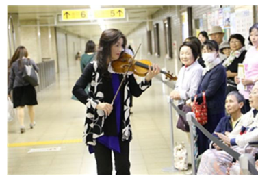
【令和元年 9月 12日 Vol. 27】