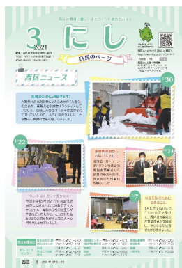
【広報さっぽろへの掲載】

また、広報さっぽろに企画「今月のやまベエフレンズ」を連載し、西区役所1階ロビーのデジタルサイネージ(電子看板)に「西区ニュース」を定期的に配信します。