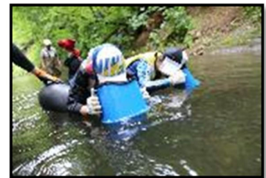
【西区コドモ自然学校】