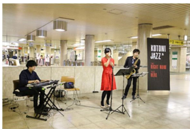
【令和元年 9月 24日 Vol. 50】

西区内の会場において、プロのミュージシャンによるジャズライブや優雅な音色が響き渡るクラシックコンサートを開催します。