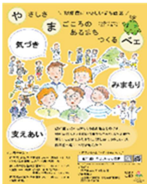
【認知症リーフレット】

認知症の方がいつまでも住み慣れた地域で生活できるよう、「認知症にやさしいまちづくり」に向けて関係機関と協働し、西区が作成したリーフレットやポスターの配布と説明をさらにすすめていきます。幅広い世代の方が認知症の理解を深め、早期に気づき、見守りや相談に結びつくよう講座等を開催します。また、認知症の方や介護者が孤立しないよう交流会等を開催します。