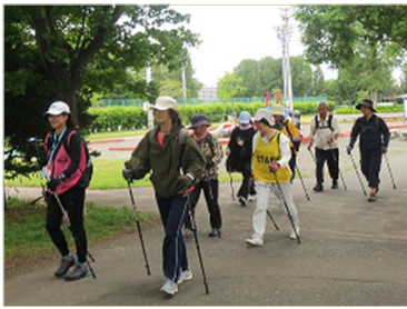
ノルディックウォーキング を活用した健康づくり

働く世代を含む幅広い世代の区民が多様なライフスタイルに合わせ、年間を通してノルディックウォーキングを活用した健康づくりに取り組むことができるよう、農試公園と保健センターを拠点として、ポールの無料貸し出し、講習、啓発イベントなどを行います。