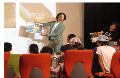
【令和元年 7月 31日開催の様子】