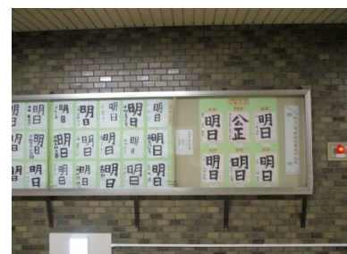
【作品展(地下鉄琴似駅構内)】

将来の有権者である子どもたちに政治や選挙への関心を高めてもらうため、区内の小学校に通う4年生から6年生を対象に書道作品を募集し、応募のあった作品を地下鉄琴似駅構内などに展示します。