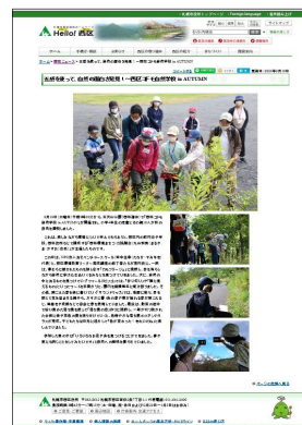
【西区ホームページへの掲載】