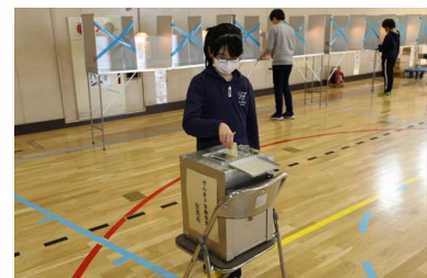
【せんきょ体験授業(模擬投票)】

将来の有権者である子どもたちに選挙の大切さを学び、選挙を身近に感じてもらうため、区内の小学校で選挙に関する講義や模擬投票を行う「せんきょ体験授業」を開催します。