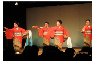
【令和2年 2月 8日開催の様子】

9月の約2週間、西区内の複数の会場を使用して、コンサート、ライブ、ダンス、演劇、日舞など様々なジャンルのイベントを開催します。