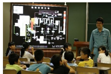
【工場見学の様子（令和元年度実施）】