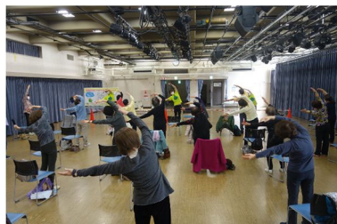
【やまべ体操教室の様子】

高齢者が健康で地域で活躍できることを目指し、住民とともに制作した介護予防体操「エコロコ!やまべ誰でも体操」を、昨年度実施した効果検証結果を活かして、普及員養成講座等の普及活動を行い、高齢者の介護予防を関係機関とともにすすめていきます。