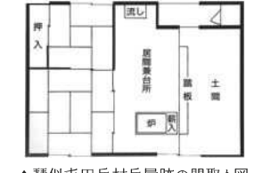
▲琴似屯田兵村兵屋跡の間取り図