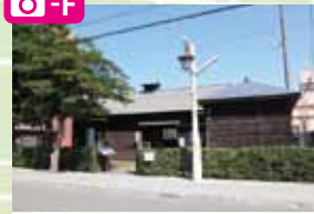
国の指定史跡である琴似屯田兵村兵屋跡(琴似2-5)は内部の見学可能。