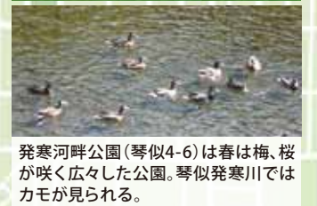
発寒河畔公園(琴似4-6)は春は梅、桜が咲く広々とした公園。琴似発寒川ではカモが見られる。

トイレ 多目的トイレ 水飲み場 駐車場 冬期間はトイレや水飲み場が使用できないところが多いのでご注意ください。