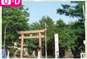
琴似神社の境内には琴似屯田兵屋が当時のまま保存されている。