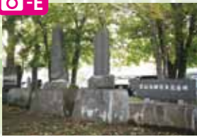
屯田の森には屯田兵ゆかりの碑があり開拓モニュメントも設置されている。春には大木の桜が見事。