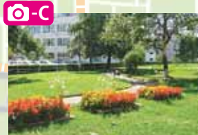
二十四軒公園(二十四軒3-4)は花や緑が豊かな広い公園。子供たちの元気な声が響く。園内には屯田兵二十四軒開拓百年記念碑がある。