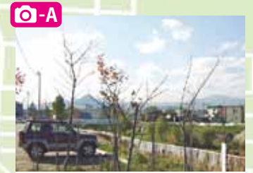
あゆみ橋からは三角山の眺めが美しい。