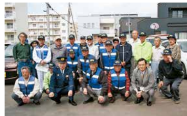
～5月7日(水曜日)に行われた出発式の様子～

八P隊の林代表は、「地域に住む子どもたちの安全や安心のため、徐々にパトロールの回数を増やしていきたい」との抱負を語っていました。