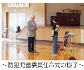
～防犯児童委員任命式の様子～

6月10日、発寒南小学校では、低学年(1～3年生)と高学年(4～6年生)それぞれを対象とした防犯教室を行いました。 防犯教室では、不審者被害を予防するための防犯標語(いかのおすし、いいゆだな)の説明が行われたほか、各学年の代表児童が、不審者役のPTAの皆さんや教職員を相手に、不審者から声かけされたときの間合いの回り方や連れ去りから逃れる行動を実践しました。 また、高学年の部で行われた「防犯児童委員任命式」では、6年生の60人全員が防犯児童委員に任命されました。 ※防犯児童委員には、下級生の模範として「いかのおすし」を実践し、日常生活の中で声かけをするなど下級生の安全に配慮した行動をとることが期待されています。