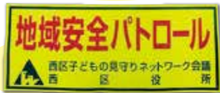
専用マグネットシート