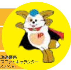
北海道警察 マスコットキャラクター ほくとくん

ほくとくん防犯メールは、登録した方のパソコンや携帯電話に以下の情報をメール配信するサービスです（配信元：北海道警察）。