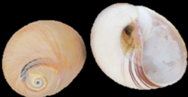
ツメタガイ 石狩湾

砂地の海底にすむ、巻貝の仲間です。殻の表面はツルリとしており、カタツムリを思わせます。アサリなど、食用の貝に穴を空けて食べてしまうことから、駆除の対象となっている地域もあります。