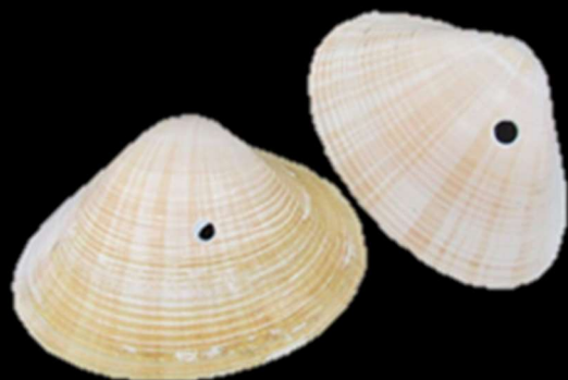
穴の空いたバカガイ 石狩湾

砂地の海底にすむ、巻貝の仲間です。殻の表面はツルリとしており、カタツムリを思わせます。アサリなど、食用の貝に穴を空けて食べてしまうことから、駆除の対象となっている地域もあります。