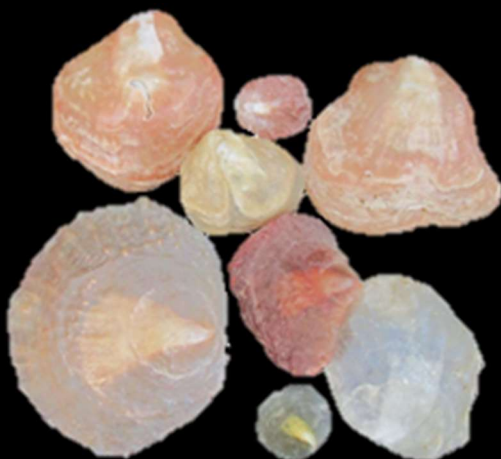
ナミマガシワ 石狩湾

海岸に行くと、このような丸い穴の空いた貝殻を見かけることがあります。この穴を空けた犯人は、とりにいるツメタガイをはじめとするタマガイの仲間です。