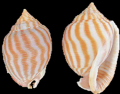
カズラガイ 北海道南部

岩場などに付着して生活する、二枚貝の仲間です。白色、赤色、橙色、黄色などさまざまな色や形のものがあります。