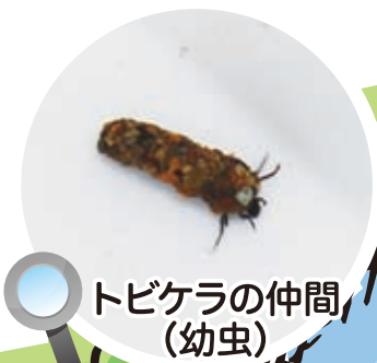
トビケラの仲間(幼虫)