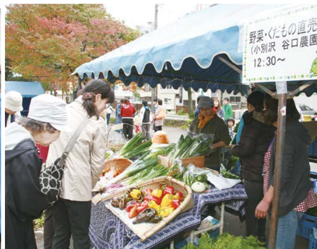
西区産の野菜と果物の販売