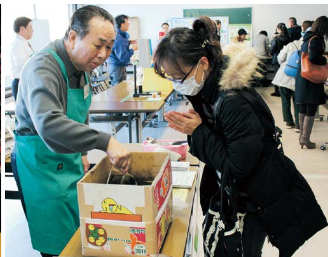
生ごみのたい肥化体験