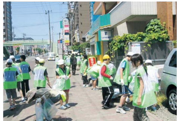
琴似小学校児童による清掃活動

平成 20 年 7 月 1 日に、地域住民やアダプト・プログラムに参加する小学校、企業などの団体が、区内の歩道や公園のごみ拾いを一斉に行いました。これは、サミットを機に来札する方を「きれいな街さっぼろ」に温かく迎えるため、「おもてなし清掃」として実施したもので、21 団体、1,429 人が参加しました。