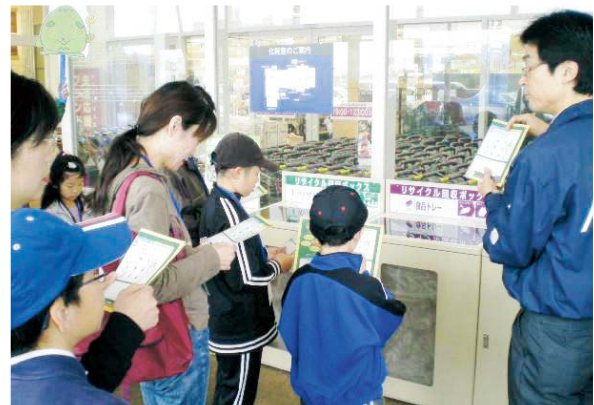
ジャスコ札幌発寒店での施設見学