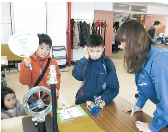
うちわでの風力発電実験