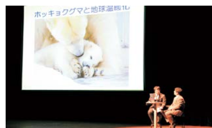
円山動物園獣医師の講演

これまで、北海道の環境保全についての対談や円山動物園獣医師による講演などが行われたほか、幅広い層に関心を持ってもらうことができるよう、ドキュメンタリー映画「アース」やアニメ映画「ウォーリー」、「ていだかんかん～海とサンゴと小さな奇跡」などの映画を上映しました。