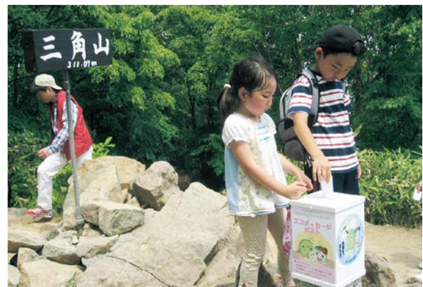
山頂のエコメッセージポスト

※サミット (summit) は、「首脳会談」のほか「山頂」を意味することから、北海道洞爺湖サミットの開催にかけて、三角山の山頂 (サミット) にポストを設置した。