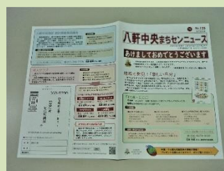
◀ A3判・両面印刷 二つ折り仕上げ

また、紙面に掲載したアンケートはがきにより、昨年度配布した冊子の啓発効果などを調べ、その結果を今後の周知方法の検討に生かしていきます。