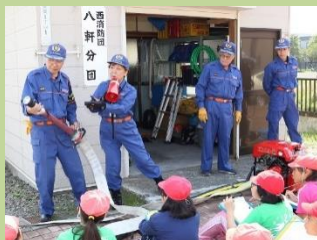
▲ 施設見学（左：消防団詰所、右：水道局施設）《10月》