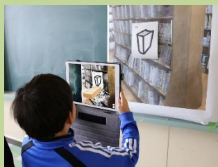
▲ 防災アプリを使った避難訓練《10月》