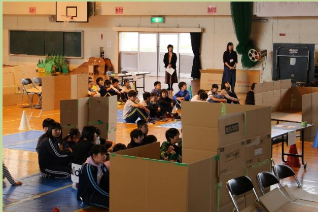
▲ 避難所設営体験《10月》