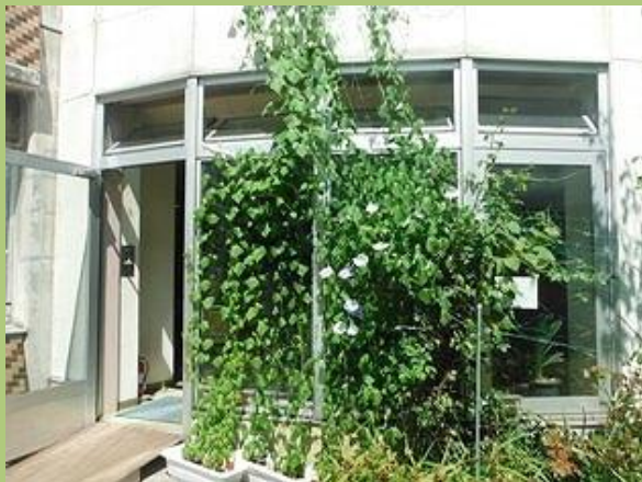
札幌太田病院 (アサガオ)