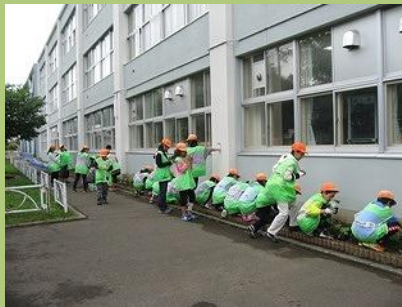
山の手小 6年生が苗の植付け