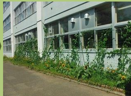
こんなに育ちました！