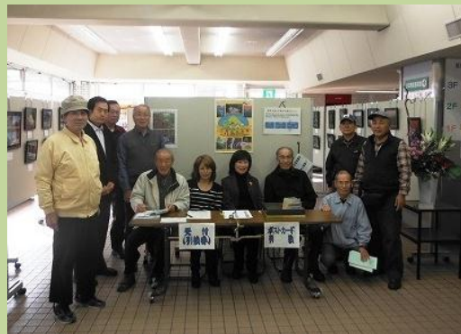
三角山ボランティアの皆さん