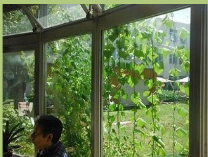
同病院食堂内から見た様子

協力施設：山の手小、山の手南小、山の手児童会館 札幌太田病院、セージュ山の手、 グループホーム山の手、山の手会館