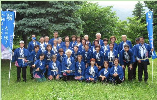
YOSAKOI 宮の沢ふれあい公園会場

今年度は、6月7日に開催されたYOSAKOIソーラン祭り「宮の沢ふれあい公園会場」へ参加（約40名）、9月4日に開催された琴似神社例大祭でのパレードへ参加（約40名）しました。また、夏祭り、盆踊りなど地域行事へも参加しました。（この取組は、八軒中央地区との連携・協力により実施しました。）