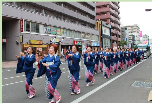
琴似神社例大祭奉納パレード