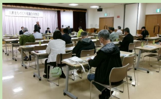
八軒まちづくり協議会で検討

八軒まちづくり協議会に所属する団体及び団体に属する個人が、ドライブレコーダー搭載車両に、まちの安全見守りステッカーを貼付し、八軒地区内を走行することで、地域の見守り行動をアピールするべく検討を重ねています。