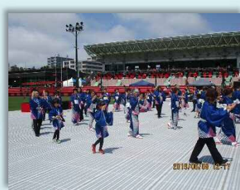
YOSAKOIソーラン祭り ハーフタイムショー（6月）