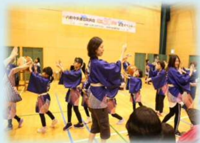
八軒音頭ジュニアのデビュー（5月）

今年度は、残念ながら、新型コロナウイルス感染症の影響により、多くの活動が中止となってしまいました。（以下の写真は、2019年度の様子を掲載しています。）