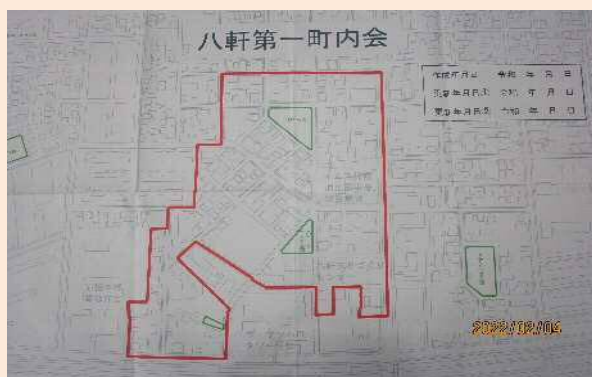
単位町内会見守りマップ