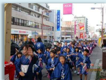
琴似神社祭典奉納 パレード（9月）

《お問い合わせ先》 月曜日～金曜日（年末年始、祝祭日を除く。）8:45～17:15 八軒まちづくりセンター（西区八軒1条西1丁目7-1） 電話 611-2221 / FAX 618-0076