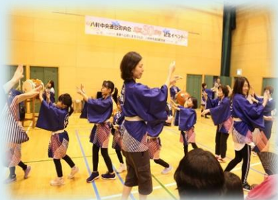
八軒音頭ジュニアのデビュー（5月）

今年度は、残念ながら、新型コロナウイルス感染症の影響により、多くの活動が中止となってしまいました。（以下の写真は、昨年度の様子を掲載しています。）