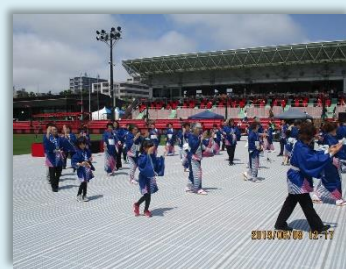
YOSAKOIソーラン祭り ハーフタイムショー（6月）