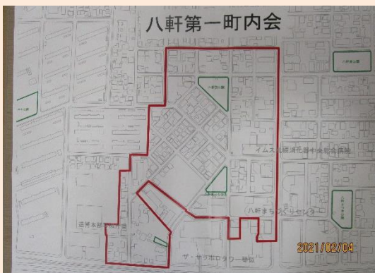
単位町内会マップ

研修会では、マップの作成方法・活用方法のほか、個人情報の取扱いなどを教えてもらいます。