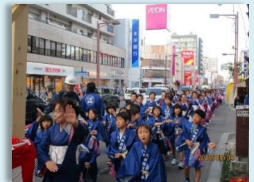
琴似神社祭典奉納 パレード（9月）

《お問い合わせ》 月曜日～金曜日（年末年始、祝祭日を除く。）8:45～17:15 八軒まちづくりセンター（西区八軒1条西1丁目7-1） 電話 611-2221 / FAX 618-0076