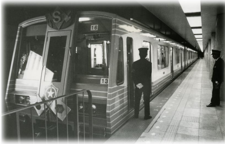
開業当初の地下鉄琴似駅 / (S51)