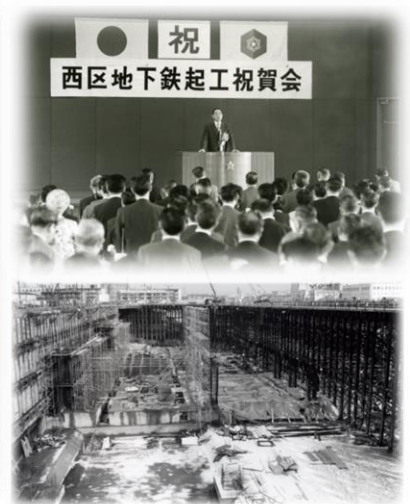
(写真上) 地下鉄起工祝賀会 (S48) (写真下) 地下鉄工事 (S48)

札幌オリンピックをきっかけに地下鉄南北線が開通したのは昭和46年(1971年)。それから遅れること5年後の昭和51年(1976年)6月10日に、札幌市営地下鉄東西線・琴似～白石間が開業いたしました。