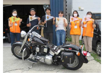
バイク店にライダーへの安全運転呼びかけを依頼