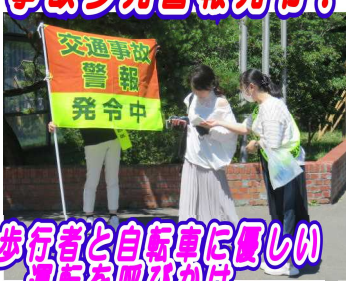
歩行者と自転車に優しい運転を呼びかけ