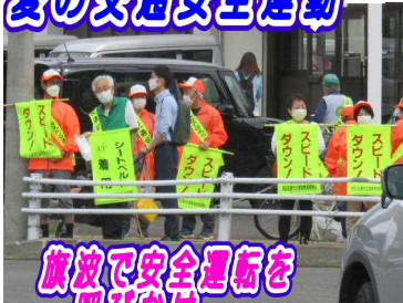
旗波で安全運転を呼びかけ