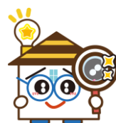
八軒中央地区 マスコットキャラクター 「はっけんくん」