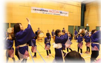
八軒音頭・ 八軒音頭ジュニア