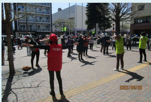
ウォーキング準備風景

道中は少々肌寒く、風も強かったですが、農試公園到着後は、ボランティアの皆さんが、朝早くから手作りで準備したお弁当を頂き、現地で解散となりました。