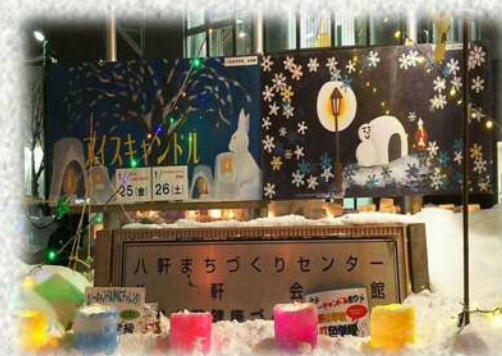
八軒の冬の風物詩