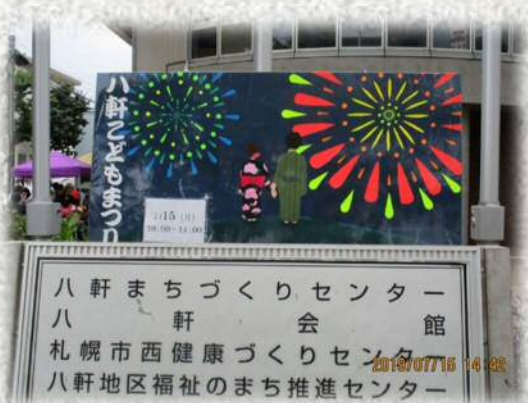
八軒の夏の風物詩

八軒東中美術部の皆さんには、冬に開催している「八軒アイスクャンドル物語」の看板も制作してもらいましたので、八軒の夏と冬の風物詩を告げるこれらのPR看板、これからも大事に使わせていただきます。ありがとうございました。