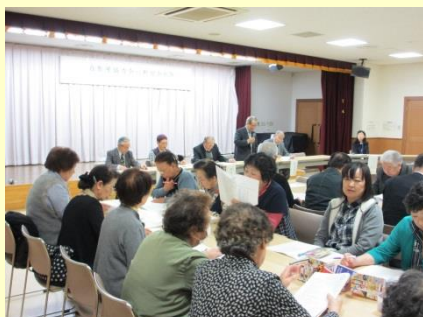
自衛隊協力会八軒分会定期総会