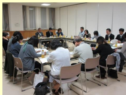
八軒地区青少年育成委員会総会