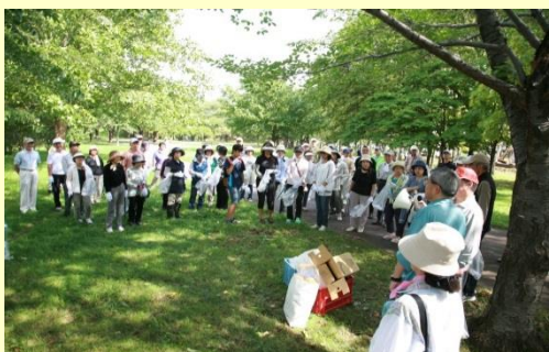
開会式には区長も激励に。さあ、たくさん拾うぞ！

秋晴れのさわやかな空の下、約 150 名のみなさんが参加し、火バサミとゴミ袋を手に、空きカンやペットボトルなどさまざまなゴミが拾い集められました。参加者の方が「年々ゴミが少なくなっているから、小さなゴミ袋で十分！」と話しておられ継続することの大切さを感じました。きれいになるとゴミを捨てにくくなり、好循環が生まれています。