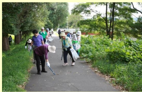
地域の皆さんで和気あいあいと。