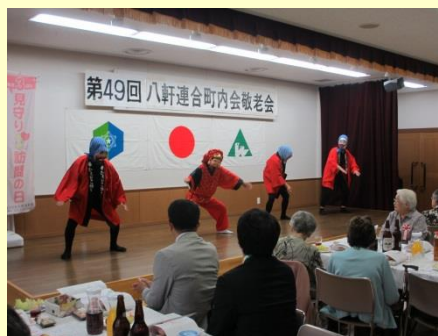
おめでたい七福ひょっとこ踊り